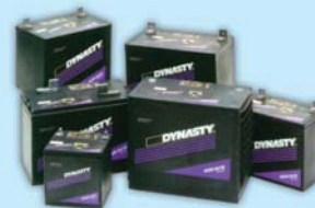
C&D (Johnson Controls) серия Dynasty (Династи) (24 А·ч ... 180 А·ч), 10 лет