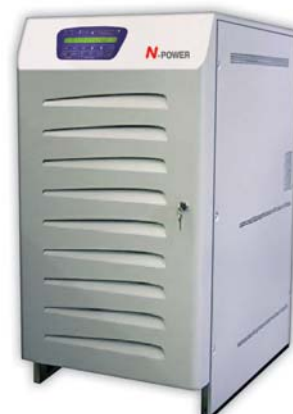
ИБП Platinum 30 кВА