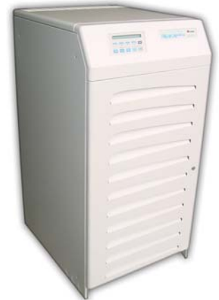
ИБП Safe-Power Evo 80 кВА