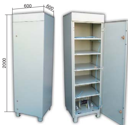
Батарейный кабинет (тип В)