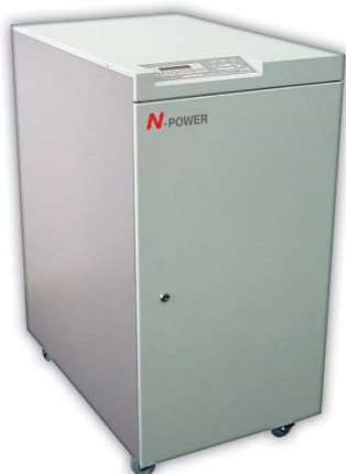
ИБП серии Lo-Power

10 кВА, 15 кВА, 20 кВА (3ф/1ф) 10 кВА, 15 кВА, 20 кВА, 30 кВА (3ф/3ф)