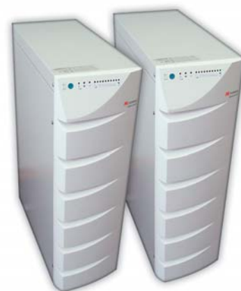
ИБП серии Blue-Point