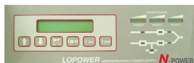
Панель управления с ЖКИ-дисплеем