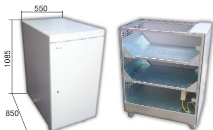
Батарейный кабинет (тип А)