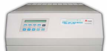
Передняя панель управления